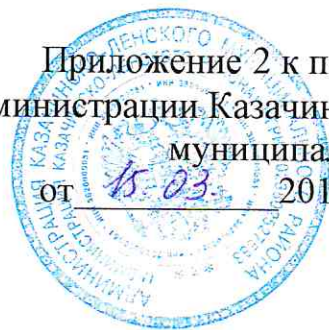
График движения междугороднего маршрута № 5 сообщением «село Казачинское – рабочий поселок Магистральный – поселок Небель»