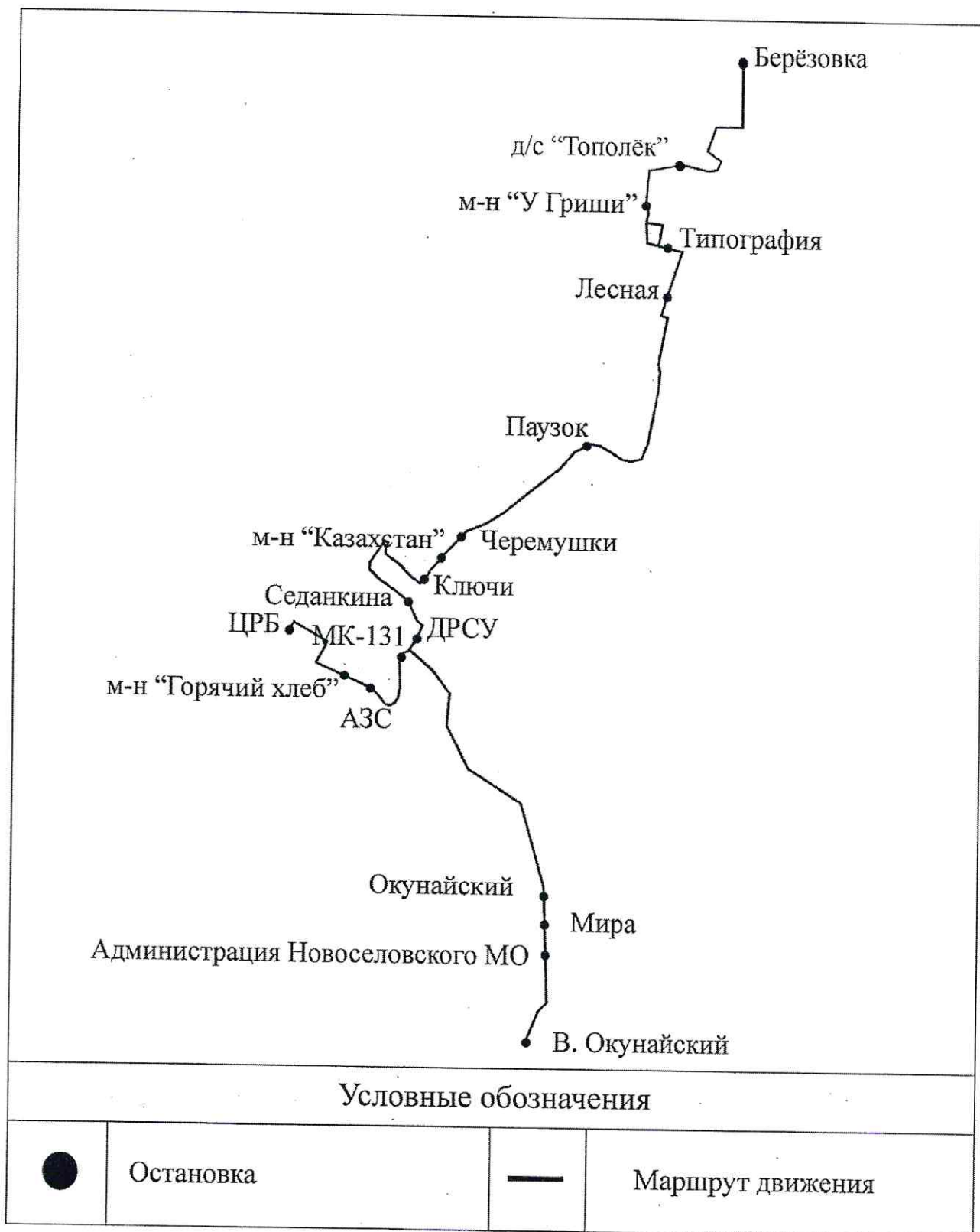
Схема маршрута междугороднего маршрута № 4 сообщением «село Казачинское – рабочий поселок Магистральный – поселок Окунайский»

И.о. заведующего отделом по АССТ и ЖКХ администрации Казачинско-Ленского муниципального района